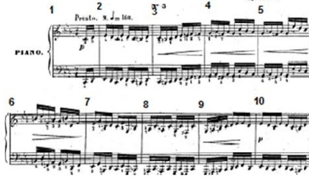
شكل رقم (١) يوضح اللحن الأول في الدراسة الثالثة