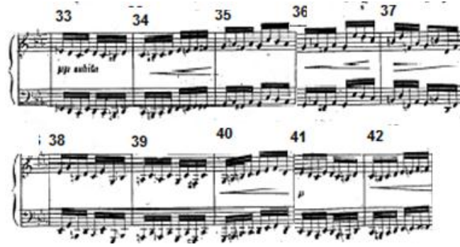
شكل رقم (٢) يوضح الإعادة الأولى للحن الأول في الدراسة الثالثة