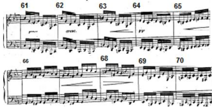
شكل رقم (٣) يوضح الإعادة الثانية للحن الأول في الدراسة الثالثة